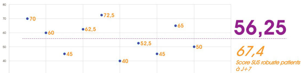
Fig 1. Score SUS des professionnels de santé (7 jours après la découverte du dispositif)

À noter : les scores individuels des professionnels de santé montrent une forte disparité dans la perception quasi-immédiate du dispositif de santé connectée proposée au sein d'UPDOCS. De fait, le score le plus faible est de 40 / 100 alors que le plus haut est de 72,5 / 100 (plus de 30 points d'écart).